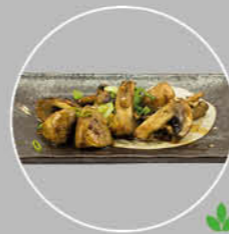
82. YAKI MUSHROOMS GEBAKKEN CHAMPIGNONS