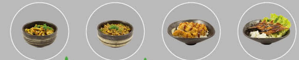
55. YAKI UDON GEBAKKEN UDON 56. YAKI MESHU GEBAKKEN RIJST 57. YAKI KARA AGE GEFRITUURDE KIP MET RIJST 58. UNAGI DONBURI PALING MET RIJST