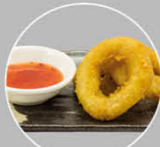
66. TAKO TEMPURA INKTVISINGEN IN BESLAG