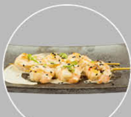
78. EBI KUSHI GARNALENSPIES