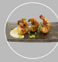
93. EBI YAKI GEGRILDE GAMBA'S