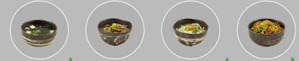
51. MISO SOUP VEGETARISCHE SOEP 52. UDON GYOU RIB-EYE BAMSIEP 53. UDON YASAI VEGETARISCHE UDON SOEP 54. YAKI RAMEN GEBAKKEN BAMM