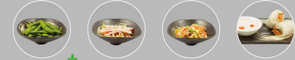
45. EDAMAME SARADA BABY SOJABONEN 46. KANI SARADA KRAB EN SLA 47. EBI SARADA GRIJZE GARNAAL EN SLA 48. FRESH SPRINGROLL SHRIMP SARADA GARNALEN