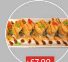
+€7,00 SUSHI VAN HET HUIS (8 STUKS) SPECIALITEIT VAN HET HUIS