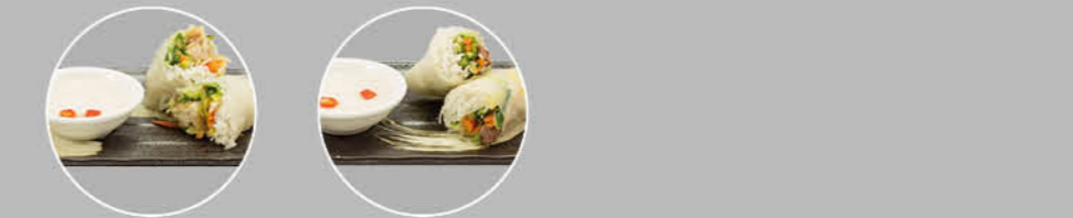
49. FRESH SPRINGROLL CHICKEN SARADA KIP 50. FRESH SPRINGROLL BEEF SARADA BEEF