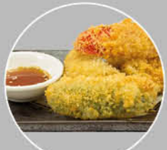
68. YASAI TEMPURA GROENTEN IN BESLAG