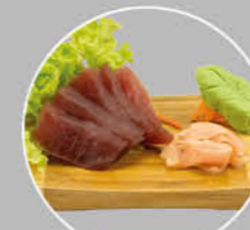
+€7,00 96. MAGURO SASHIMI TONIJNREEPIES