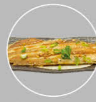
92. UMI KAREI ZEETONG MET KNOFLOOK BOTER