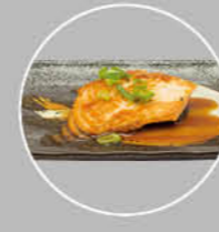
86. SAKE TERIYAKI GEGRILDE ZALM