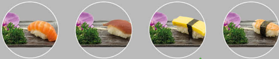
1. SAKE NIGIRI ZALM 2. MAGURO NIGIRI TONIJN 3. TAMAGO NIGIRI ZOETE OMELET 4. EBI NIGIRI GEKOOKTE GARNAAL