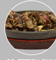
89. TETSU GYU BEEF MET ZWARTE PEPER