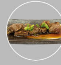
87. GYU TERIYAKI BEEF VAN DE BAKPLAAT