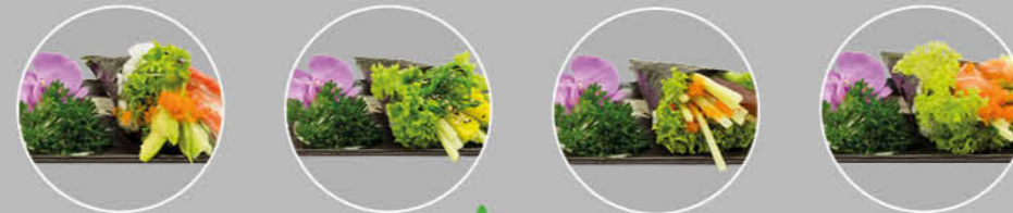
35. CALIFORNIA TEMAKI KOMKOMMER, AVOCADO EN KRAB 36. YASAI TEMAKI KOMKOMMER, ZEEWIER, RADIS EN SLA 37. MAGURO TEMAKI KOMKOMMER, TONIJN EN SLA 38. SAKE TEMAKI KOMKOMMER, ZALM, AVOCADO EN SLA