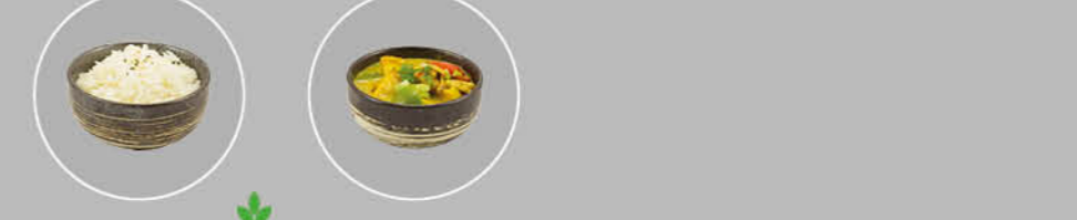
59. HAKUHAN WITTE RIJST 60. KATSU CURRY KIP CURRY