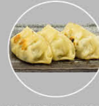
88. GYOZA STICKS KIP EN GROENTE PASTEITJE