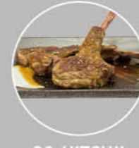
90. HITSUJI LAMSKOTELET