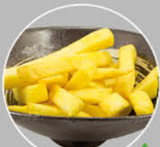
73. FURAIIDO POTATO FRIETJES