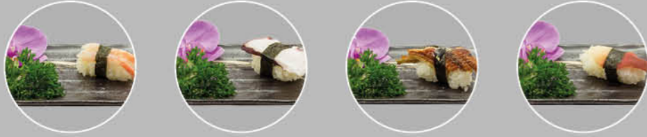
5. AMA EBI NIGIRI ZOETWATER GARNAAL 6. TAKO NIGIRI OCTOPUS 7. UNAGI NIGIRI PALING 8. HOKKIGAI NIGIRI SURFMOSSEL