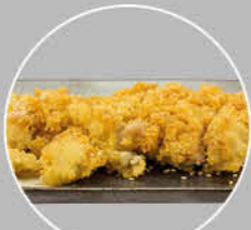
65. KARAAGE KIP