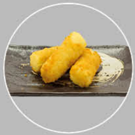
61. POTATO CHEESLICES AARDAPPELKAAS SCHIJFJES