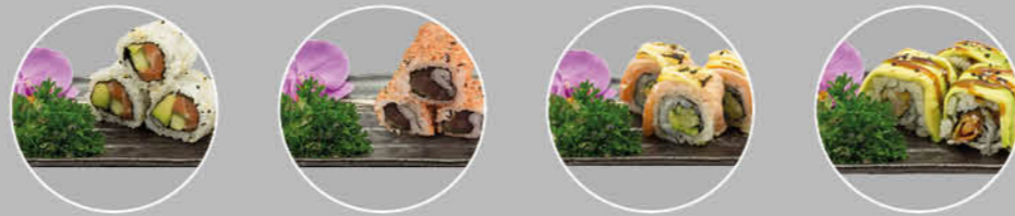
27. SAKE ROLL MAKI ZALM, AVOCADO EN KOMKOMMER 28. SPICY SALAD ROLL MAKI TONIJN, CHILU EN KOMKOMMER 29. SAKE CHEESE ROLL MAKI ZALM, KAAS EN AVOCADO 30. DRAGON ROLL MAKI GEFRITUURDE GARNAAL EN AVOCADO