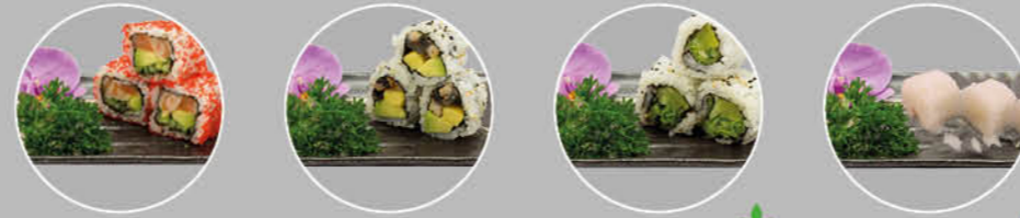
31. ALASKA ROLL MAKI ZALM, AVOCADO EN OMELET 32. UNAGI ROLL MAKI PALING, AVOCADO EN OMELET 33. YASAI ROLL MAKI RADIS, SLA EN KOMKOMMER 34. BANANA ROLL MAKI KOKOS, BANANEN EN AVOCADO