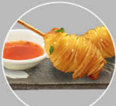
69. EBI KOROKKE GARNALEN KROKET