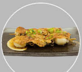
79. IKA KUSHI INKTVIS

VOORKOM VERSPILLING VAN VOEDSEL, NIET GECONSUMEERDE ITEMS WORDEN IN REKENING GEBRACHT. €1,00 PER SUSHI & €3,00 PER HANDROL / WARM GERECHT.