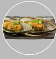
84. MURU KAI GREENSHELL MUSSELS