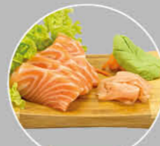
+€6,00 95. SAKE SASHIMI ZALMREEPIES