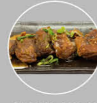
91. YAKI AHIRU GEBAKKEN EEND