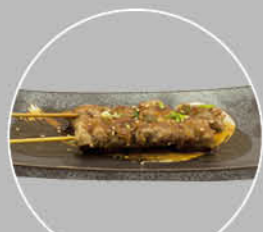
74. KOHITSUJI KUSHI LAMSPIES