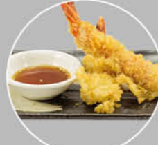
67. EBI TEMPURA GARNAAL IN BESLAG