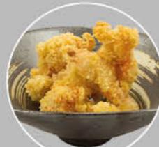
71. SAKE TEMPURA ZALM IN BESLAG