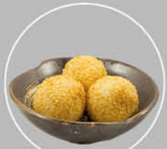
64. GOMABORU SESAMBOLLETJES