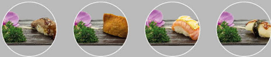
9. BEEF NIGIRI BEEF 10. INARI NIGIRI TOFU 11. SAKE CHEESE NIGIRI ZALM EN KAAS 12. HOTATE NIGIRI SINT JACOBS VRUCHT