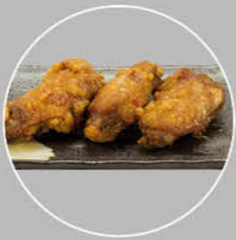
62. TEBA YAKI KIPPENVLEUGELS