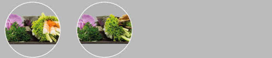
39. EBI TEMAKI KOMKOMMER, GARNAAL EN SLA 40. UNAGI TEMAKI KOMKOMMER, PALING EN SLA