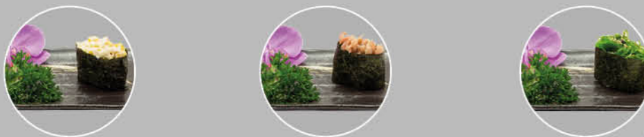
13. CORN GUNKAN MAIS EN KRAB 14. TABI GUNKAN GRIJZE GARNAAL 15. CHUKA WAKAME GUNKAN ZEEWIER