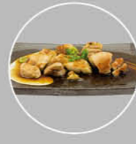
85. TORI TERIYAKI KIPBLOKJES VAN DE BAKPLAAT