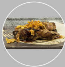
81. USUYAKI BEEFROLLETJES