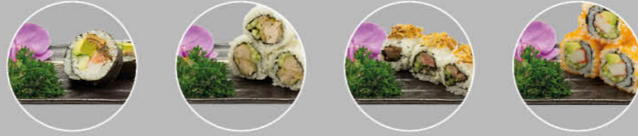
23. FUTOMAKI MAKI KOMKOMMER, KRAB, ZALM, TONIJN, AVOCADO EN RADIS 24. CRISPY CHICKEN ROLL MAKI KOMKOMMER EN KROKANTE KIP 25. BEEF ROLL MAKI BEEF, KOMKOMMER EN GEFRITUURDE UIEN 26. CALIFORNIA ROLL MAKI KRAB, AVOCADO EN KOMKOMMER