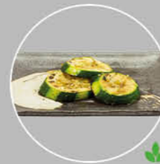
83. YASAI MORI GEBAKKEN COURGETTE