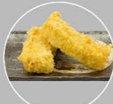
70. BANANA TEMPURA BANAAN IN BESLAG