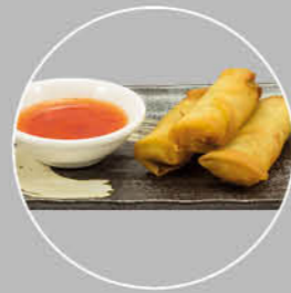
63. HARUMAKI LOEMPIAS