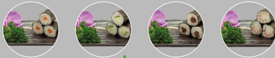
19. SAKE MAKI ZALM 20. KAPPA MAKI KOMKOMMER 21. TEKKA MAKI TONIJN 22. KANI MAKI KRAB