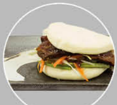
72. DUCK BAPAO BROODJE MET EEND