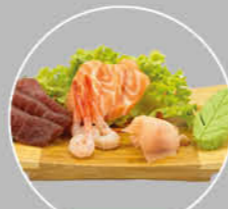
+€8,00 94. SASHIMI MORIAWASA ZALM, TONIJN EN GARNALEN