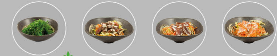
41. CHUKA WAKAME SARADA ZEEWIER 42. GYUNIKU SARADA BEEF EN SLA 43. SASHIMI ZALM SARADA ZALM EN SLA 44. SASHIMI TONIJN SARADA TONIJN EN SLA